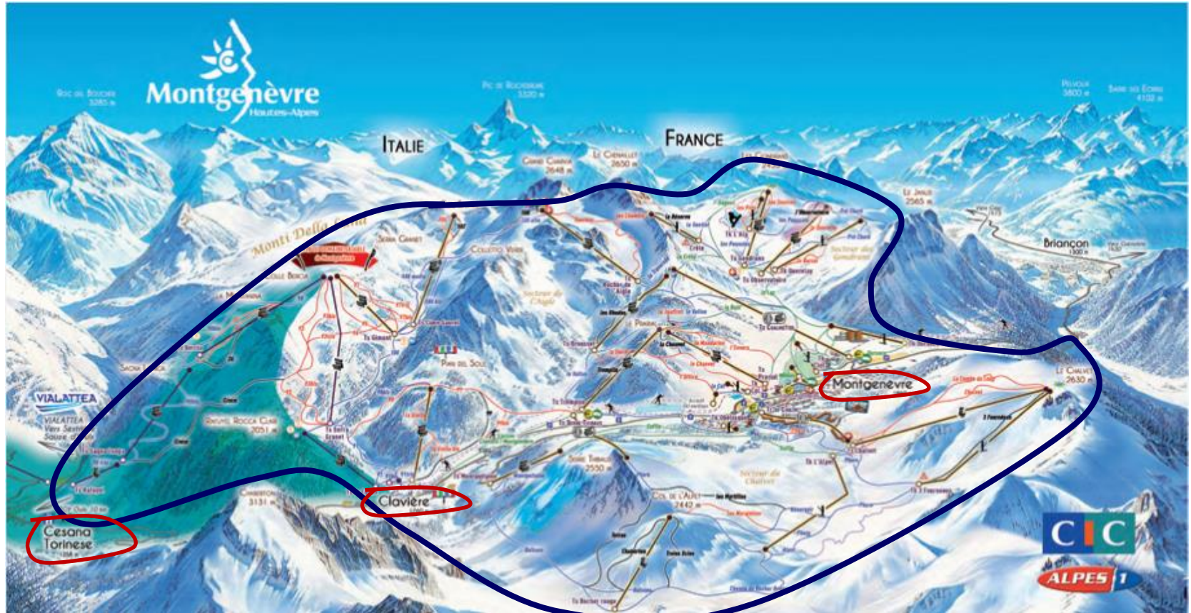
Les Monts de la Lune