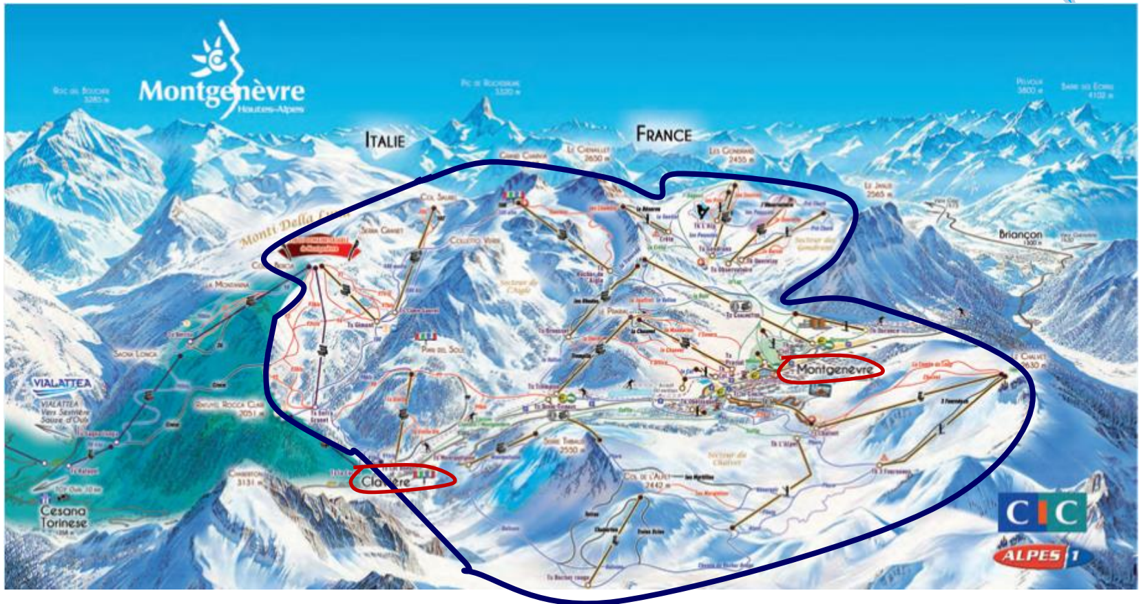
Le Grand Montgenèvre